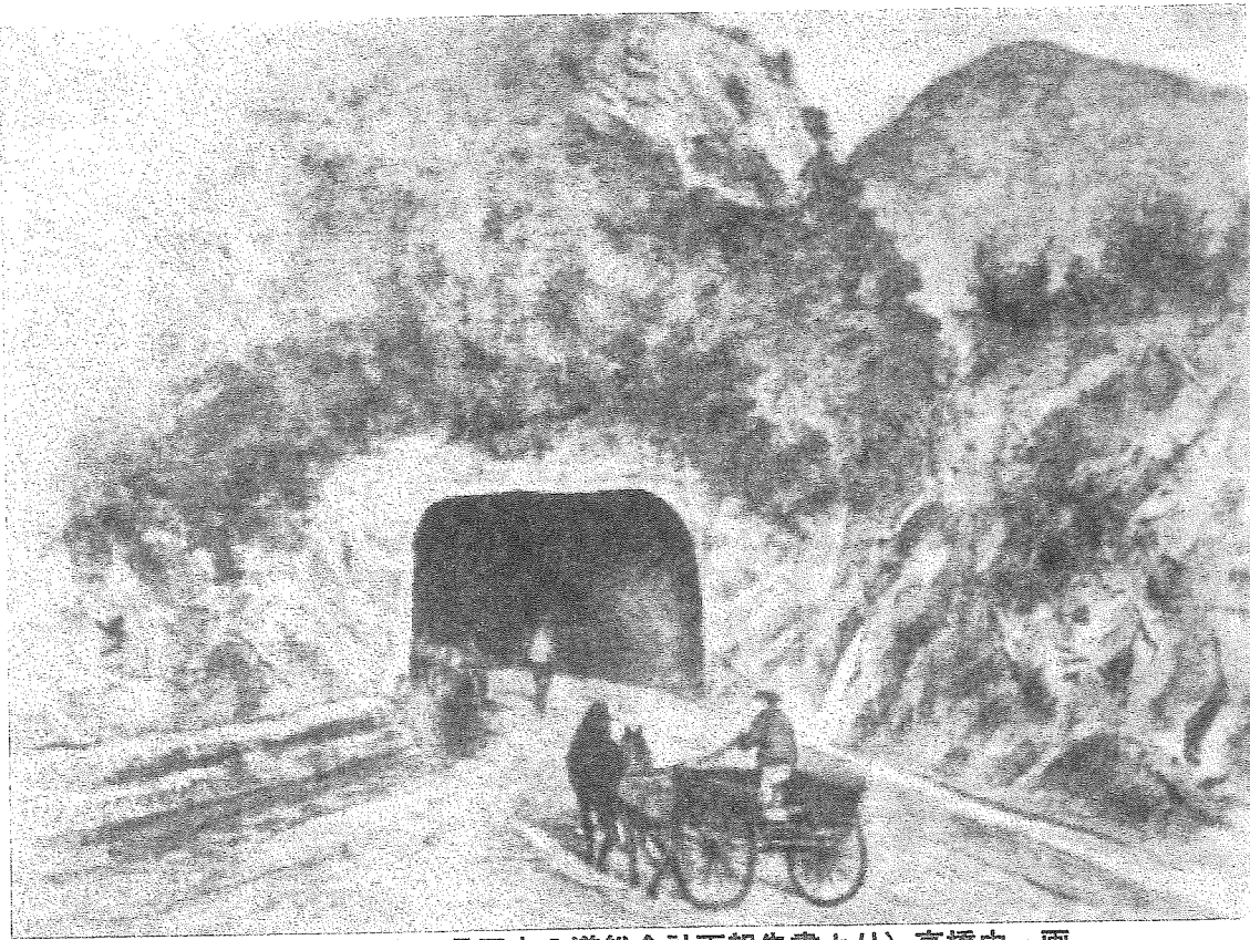
栗子隧道西口図 (2002 : 山形県歴史の道総合計画報告書より) 高橋由一画