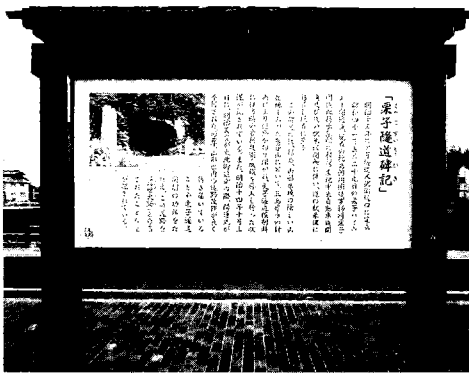
「栗子隧道碑記」の説明板