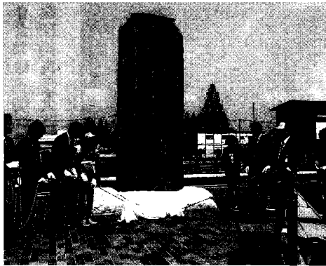
「栗子隧道碑記」の移設除幕式